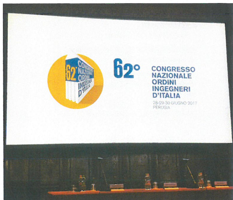
Precongresso del 27 giugno 2017 a Perugia