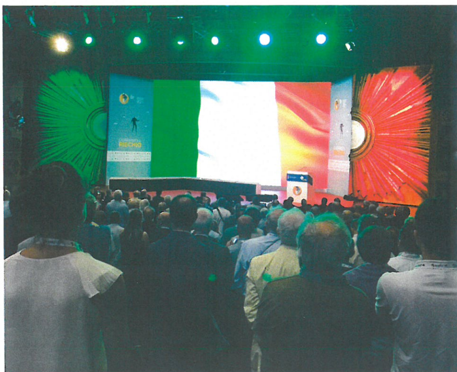
Cerimonia di inaugurazione del 28 giugno 2017